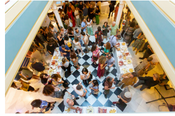
Galería de fotos PrEP Party 2022

¿Cuántas personas tenemos ya en seguimiento en SIPrEP?